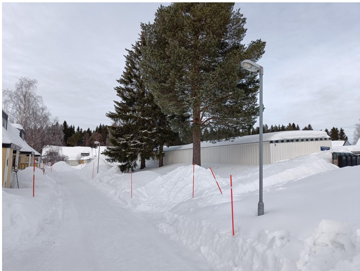
3 st stora träd vid Lagmansvägen 93-99.

Styrelsens förslag är att det på följande platser tas ett beslut om träd ska tas bort och ersättas av annan växtlighet. Samråd kring vilken ny växtlighet som ska planteras kommer att beslutas inom styrelsen efter kontakt med någon landskapsarkitekt eller liknande.